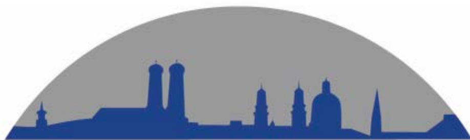
B.G.L. Convest GmbH