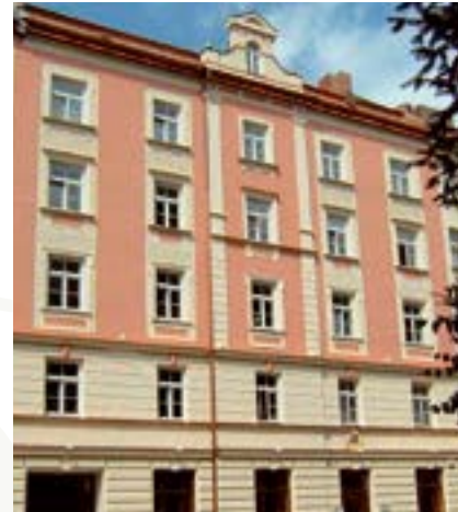
PARISER STR. 19